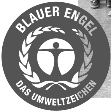
Die Umweltdetektive der Grundschule Sandweiler